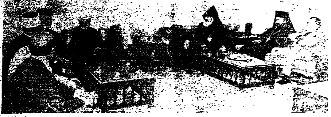
الرئيس كرامي يتوسط أعضاء لجنة العائلات الرومية. قامت اللجنة الدائمة للعائلات الرومية بزيارة الرئيس رشيد كرامي للشيخ صبحي الصالح بالتصريح ولا سيما بعد أن مضى وقت قصير على تسليم الرئيس كرامي للحكم. ولم يكن غرضنا من الزيارة أن نؤدي تليدنا الذي لا بد منه لبعض الاجازات التي يبدو لنا انها تفتحت في وقت خاطئ في ميدان استتباب الأمن وعودة النور الى ما يشبه حلقها الطبيعية. وانما كانت زيارتنا وفيه تبادل وجهات النظر مع الرئيس كرامي بوصفه اكرم الشخصيات الوطنية في هذا البلد، وبوصفه كلف بتشكيل الحكومة، استجابة لرغبة شعبية وجماعية... وفيه شيء أخطر أساسي، وهو تتبع التطورات والراجل التي تتصاحب بسرعة مفيدة في موضوعات تدور حول الدولة الحديثة وصورة الأعمال المستقبلية التي تشكل لوتنا كثيرا من الاستقرار، مما يؤكد بناء الدولة على أسس سليمة وطنية.

والصنف من صباح اليوم، في مقر وكالة «وفا»، وكلف عن مزيد من التفاصيل عن الاعتداءات التي جرت أمس، والخسائر، وبعض المعدات التي تم الاستيلاء عليها. رصاص طائش يقتل شابا في طرابلس طرابلس - خلس: نقل في الساعة العاشرة عشرة إيلا بطرابلس عيد الله أحمد صلحفة (٢٥ سنة) من محلته جبل مصنف، العمالي التي مستشفى أورتل دو، وسرعان ما غرق الحياة حيث تبين انه مصاب بطلق ناري تحت عينه اليمنى. ولم تعرف أسباب اصيابه بعد، لكن مصادر التحقيق نفتقد انه اصيب برصاص طائش، خصوصا ان المنطقة تشهد حوادث اطلاق نار بشكل يومي، وهذا ما يقارب التسويج.